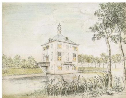
Hofwijck, getekend door Christiaan Huygens in 1658.

waren ze bij de koningin, 's middags bij ons.“